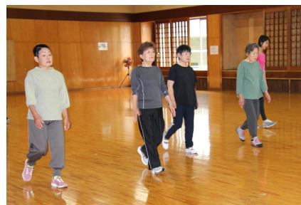
【骨盤腸整ウォーキング】