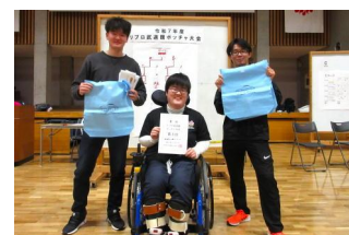
1位・ボッチャマン