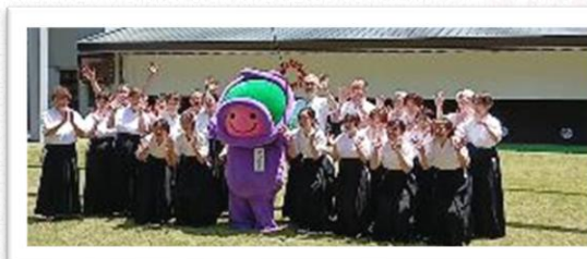
スポーツフェア2026・第9回武道祭での集合写真

正式名称を「全国健康福祉祭」といい、60歳以上の方を 中心に開催される全国規模のイベントです。 スポーツや文化活動を通して、交流や健康づくりを目的に 開催されています。