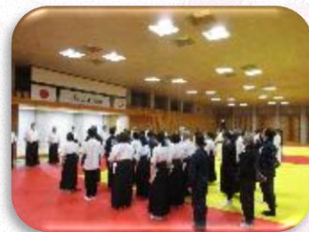
4月18日に行われた 武道塾弓道・少林寺拳法教室合同開講式