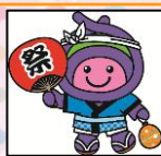
上尾市のマスコット アッピー

5月17日(日)に「スポーツフェア2026・第9回武道祭」を開催しました。 武道をはじめ様々なスポーツの体験会、演武披露を行い、多くの方にご参加いただきました。 ご来場いただいた皆様、誠にありがとうございました。