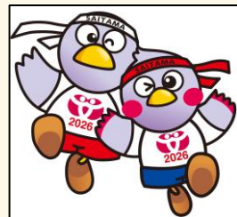
埼玉県のマスコット 「コバトン」「さいたまっち」

今年、埼玉県で開催される「ねんりんピック」の 弓道競技が、当武道館で行われます。 全国から集まる選手たちの迫力ある競技を ぜひ会場でご覧ください、皆様のご来館をお待ちしております。