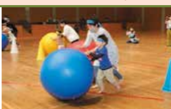
親子エンジョイスポーツ