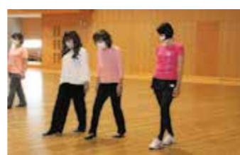
骨盤腸整ウォーキング