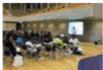
カラダを守る乳酸菌