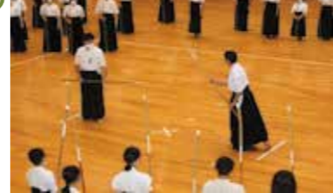
トップアスリートなぎなた講習会