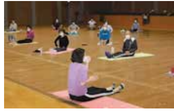
フィットネスヨガ