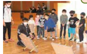
ENJOYチャレンジゲーム