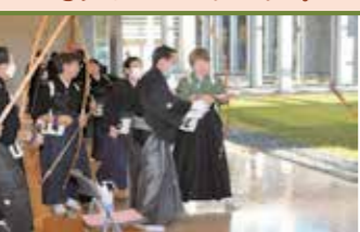
指導者研修会(弓道)