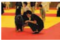
けが予防ストレッチ