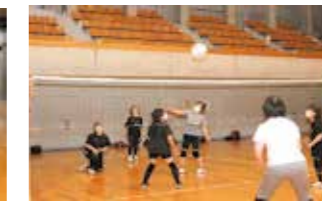
ソフトバレーボール