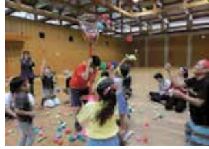
親子エンジョイスポーツ