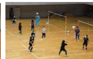
ソフトバレーボール