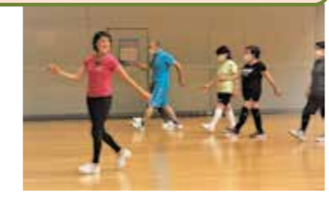
骨盤腸整ウォーキング