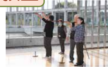
スポーツウエルネス吹矢