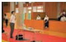
カラダを守る乳酸菌