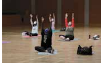
フィットネスヨガ