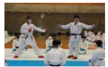
青少年空手道組手講習会